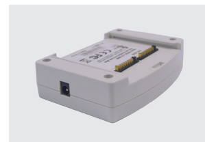
CARGADOR DE BATERÍA DE ESCRITORIO (OPCIONAL)