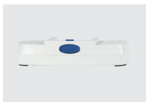
BATERÍA DE 8 CELDAS