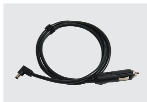
CABLE DE ALIMENTACIÓN DE CC