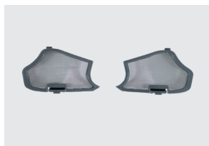
FILTRO EXTERNO PARA PARTICULAS GRUESAS